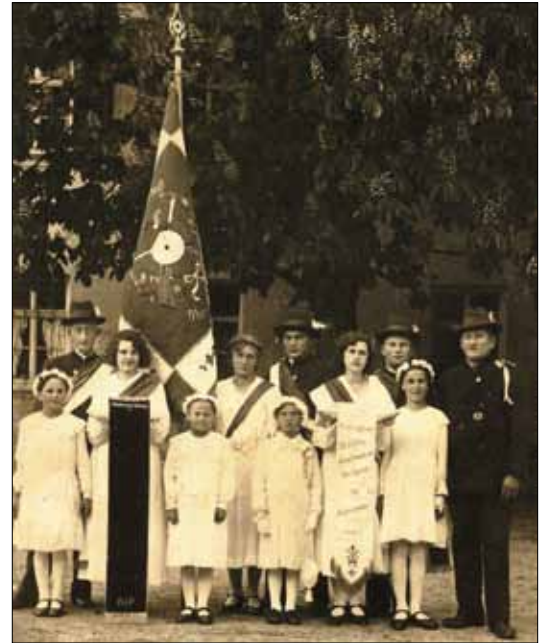
Fahnenweihe der Schützengesellschaft Obergriesbach