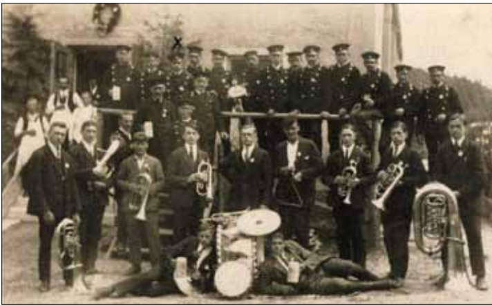
Blaskapelle des Männergesangsvereins Zahling im Jahre 1925

„Vereine waren und sind ein äußerst wichtiges Bindeglied innerhalb einer Dorfgemeinschaft. Auch unsere multimediale Gesellschaft kann nicht darüber hinwegtäuschen, dass der Wunsch nach persönlichen Gesprächen und gemeinsam vorzunehmenden Aktivitäten ungebrochen ist. Die Geschichte der Zahlinger und Obergriesbacher Vereine weist bei allen eine solide Beständigkeit auf. Auch die beiden Weltkriege haben nur vorübergehend das Vereinsleben lahm gelegt.“