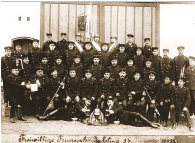
Die Zahlinger Feuerwehr im Jahre 1912