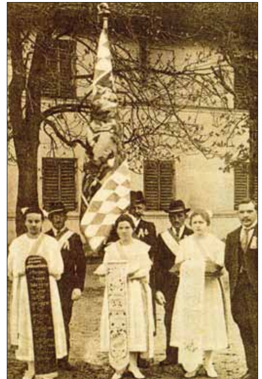
Fahnenweihe des Krieger- und Soldatenvereins Obergriesbach, 1921